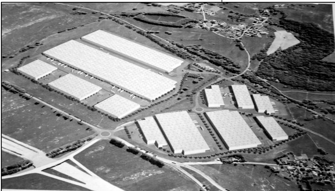
Park Žďárek - 33 hektarů plechu a afaltu. Na snímku vpravo dole Žďárek, nahoře Žďár. Největší hala má mít rozměry 513 x 151 m.

Největší chybu dělá ten, kdo nedělá nic v domnění, že to málo, co udělat může, je bezvýznamné. (E. Burke)